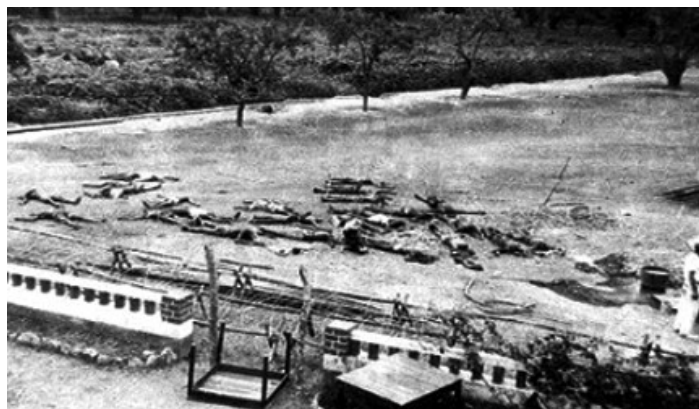
Fig. 2. Cádaveres em campo de batalha. Fonte: < http://noticias.sapo.ao/info/artigo/1465050.html >. [Consulta realizada em 21/12/2016]