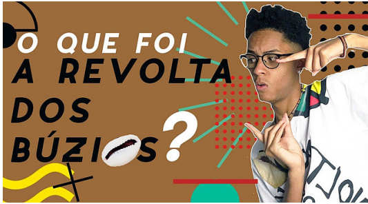
Fig. 3. Versão C: Screenshot do arquivo de vídeo O que Foi a Revolta dos Búzios – Meus Heróis Negros Brasileiros .

negros no Rio de Janeiro com apenas 13 anos com as seguintes frases: «Você vive no Brasil? É jovem? É negro? Vive em favelas ou bairros periféricos? Sim, eu queria ser mais delicado ao dizer isso, mas você tem 25 vezes mais chance de ser assassinado do que jovens brancos brasileiros!»