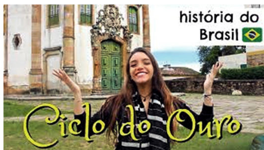
Fig. 2. Versão B: Screenshot do arquivo de vídeo Resumo de História: Ciclo do Ouro – em Ouro Preto, MG!

O segundo vídeo, chamado Ciclo do Ouro , no canal Débora Aladim, é a versão B.