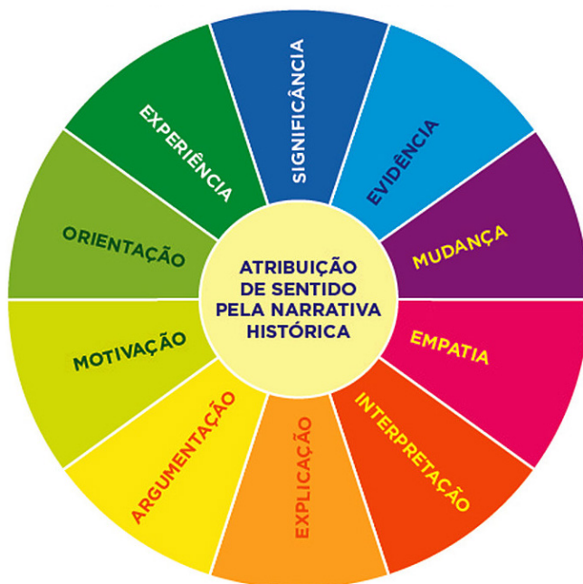
Fig. 1. Matriz: Competências do Pensamento Histórico

Sempre ressaltando que a vida prática é o ponto de partida e de chegada do trabalho com a formação do pensamento histórico e a natureza integrada entre elas, com a finalidade da construção de sentido, foram sistematizadas algumas categorias que poderão ser trabalhadas como competências do pensamento histórico e ser constitutivas da orientação dos processos didáticos, tais como organização e planejamento de atividades de ensino e avaliação, na educação histórica.