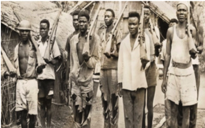
Fig. 1. Homens armados em parada. Fonte: < http://noticias.sapo.ao/info/artigo/1465050.html >. [Consulta realizada em 21/12/2016]

Após as análises efetuadas aos dados resultantes das aulas oficinas, pode-se depreender que há um longo trajeto a percorrer relacionado com a área da Educação Histórica, conquanto os atores-chave deste processo nos ensaios realizados perceberam ser possível a aplicação de uma metodologia, trabalhosa mas frutuosa, no sentido de que desvela as dificuldades dos alunos em desenvolver um pensamento histórico e concomitantemente as dos professores. Tem-se a consciência de que as dificuldades denotadas podem ser consentâneas com o facto de os alunos estarem acostumados a aulas de outra natureza; com o tipo de música proposta por exemplo; com as fontes utilizadas; ou com o método e a forma de ensinar. A verdade é que esta tipologia de aulas desvela dificuldades que podem constituir um fio condutor para que o professor reflita sobre como ensina determinados conteúdos, e a possibilidade de adaptar as práticas de ensino às dificuldades observadas nos alunos e a sua melhoria continuamente.